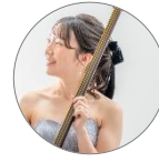
つづき かとれ 都築 かとれ